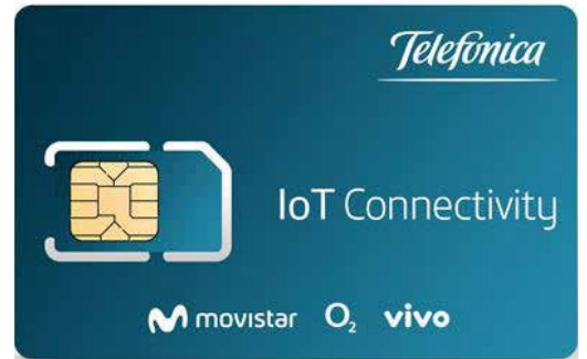
Telefónica SIM-Karte für M2M IoT Anwendungen Global SIM Vivo-o2-Movistar

Für IoT Connect haben wir eine Reihe von verschiedenen SIM-Typen und Formfaktoren im Portfolio, um die spezifischen Bedürfnissen von M2M oder IoT-Anwendungen zu erfüllen. Je nach Einsatzbereich bieten wir neben Standard IoT SIM-Karten für normale Bedingungen, auch spezielle robuste SIM-Karten für den Gebrauch unter besonders rauen Umgebungsbedingungen. Diese SIM-Karten - Industrial SIM - arbeiten selbst bei stark schwankenden Temperaturen von -40 bis +105 Grad Celsius zuverlässig und sind unempfindlicher gegen Erschütterungen. Die Industrial SIM von Telefónica gibt es als Plug-In SIM-Karte in verschiedenen Größen oder als SIM-Chip, der fest im M2M-Funkmodul auf der Platine verlötet wird.